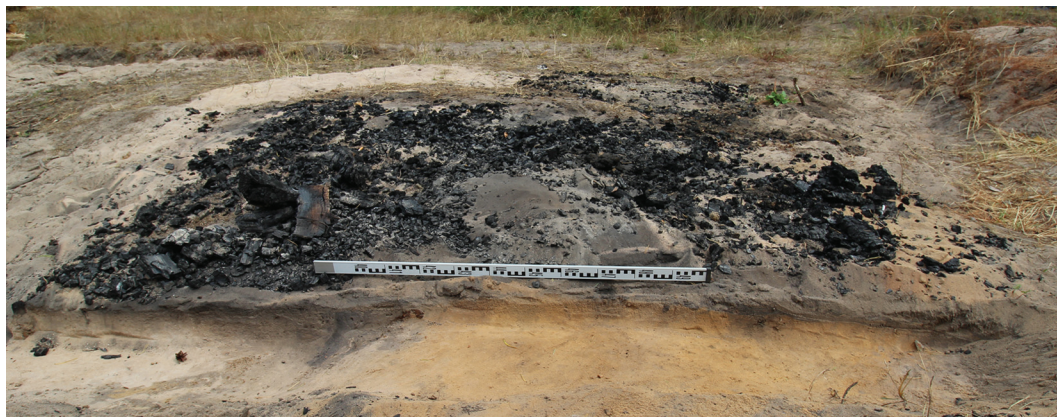
Рисунок 5. Разрез грунта под кострищем (фото с запада) Figure 5. Cross-section of the ground under the fireplace (photo from the west)