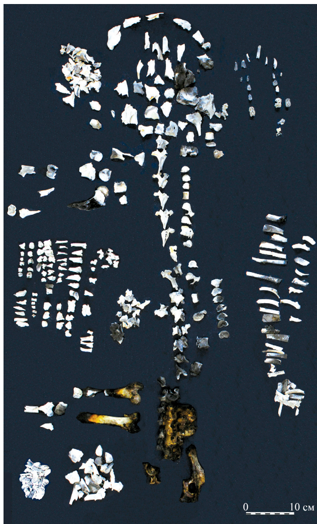
Рисунок 6. Сохранность костей свиньи после сожжения Figure 6. Preservation of pig bones after burning

ность наблюдается на фрагментах черепа, шейных и грудных позвонках, костях предплечья, голени, кистей и стоп. Неоднородный цвет зафиксирован на ребрах и позвонках поясничного отдела. Важно отметить, что на позвонках грудного отдела прослеживается достаточно резкий переход от одного цвета к другому: левая сторона – белого цвета, правая – от коричневого до серого и светло синего (рис. 7). Это связано, в первую очередь, с положением туши на погребальном костре, тепловое воздействие на левую сторону было более интенсивным.